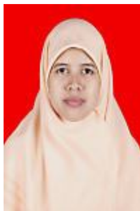
Foto yang telah Anda upload akan dipakai pada Kartu Tanda Mahasiswa (KTM) jika Anda lulus seleksi masuk UI.